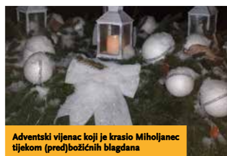
Adventski vijenac koji je krasio Miholjanec tijekom (pred)božićnih blagdana

Što se tiče života u selu nastojimo ga živjeti