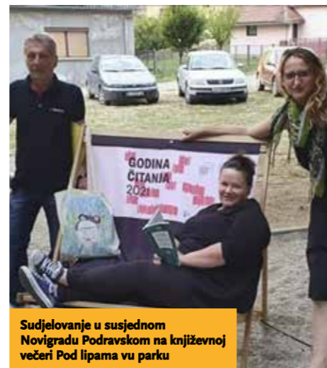
Sudjelovanje u susjednom Novigradu Podravskom na književnoj večeri Pod lipama vu parku