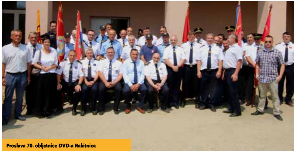
Proslava 70. obljetnice DVD-a Rakitnica