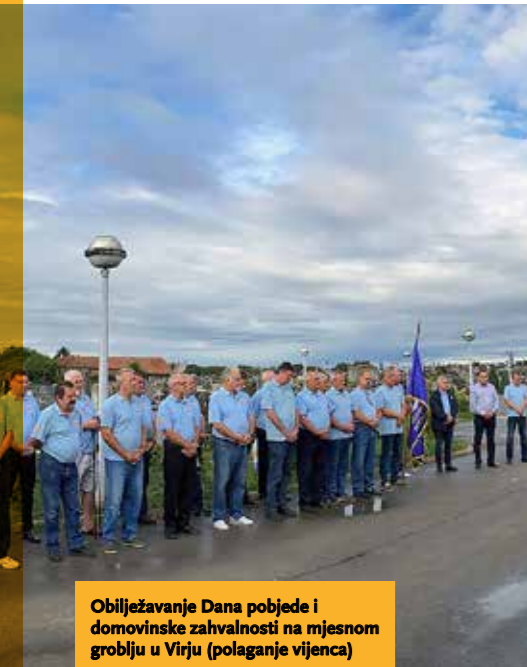
Obilježavanje Dana pobjede i domovinske zahvalnosti na mjesnom groblju u Virju (polaganje vijenca)