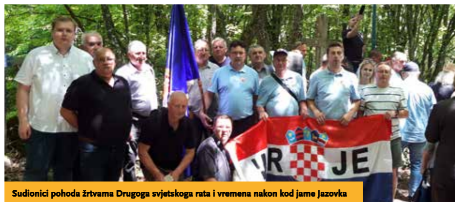
Sudionici pohoda žrtvama Drugoga svjetskog rata i vremena nakon kod jame Jazovka

Dana 7. kolovoza 2021. od 17 sati organizirano je druženje uz glazbu, besplatne napuhance i zabavne igre, a od 21 sat pod zvjezdanom nebom svi zainteresirani mogli su pogledati obiteljski film Mia i bijeli lav . Posjetitelji su uživali u svim aktivnostima koje je pripremila tvrtka Dergez u suradnji s Općinom Virje, a po broju posjetitelja i raspoloženju koje je vladalo, moglo se zaključiti da je ovakvo obiteljsko druženje itekako dobrodošlo. ●