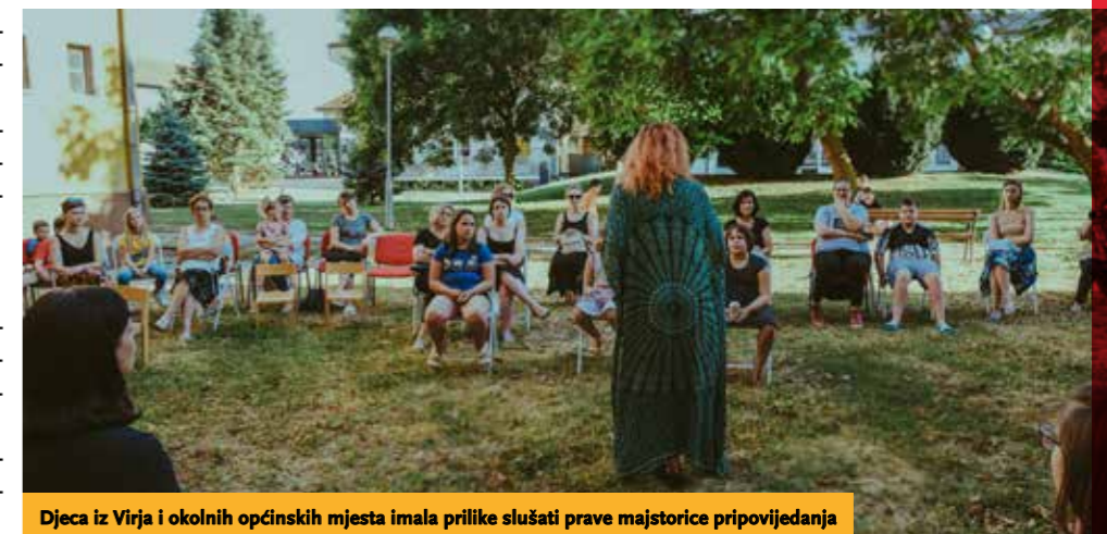
Djeca iz Virja i okolnih općinskih mjesta imala prilike slušati prave majstorice pripovijedanja

ble, PlayStation i VR-set te nadogradnje za postojeća računala. Želja nam je bila da ne ostane sve na računalnoj tehnologiji. Ljetni istjerivači dosade stoga su bili oblikovani prema STEM+A principu koji nam govori da uz poučavanje o znanostima, tehnologiji i matematici treba istovremeno poticati i umjetničko izražavanje i stvaranje. Dvadeset i jedna radionica za djecu svih uzrasta ili pak obiteljski oblikovane večeri obuhvatile su sve od programiranja, videoeuređivanja, digitalnog crtanja i kadar-po-kadar animacije do terapijskog crtanja zentangle i mandala te pripovijedanja. Ispunili smo si dugogodišnju želju organizacijom kina na otvorenom i u knjižnicu opet doveli originalne sadržaje kakvih dosad nije bilo u našoj knjižnici kao što je skupni nastup pripovjedača i igra Čiri biri bajka . Novu jesen dočekujemo baterija napunjenih dječjim smijehom i druženjem s našim korisnicima i dvostrukim planovima za svako naše događanje koje u tili čas može postati offline ili online .