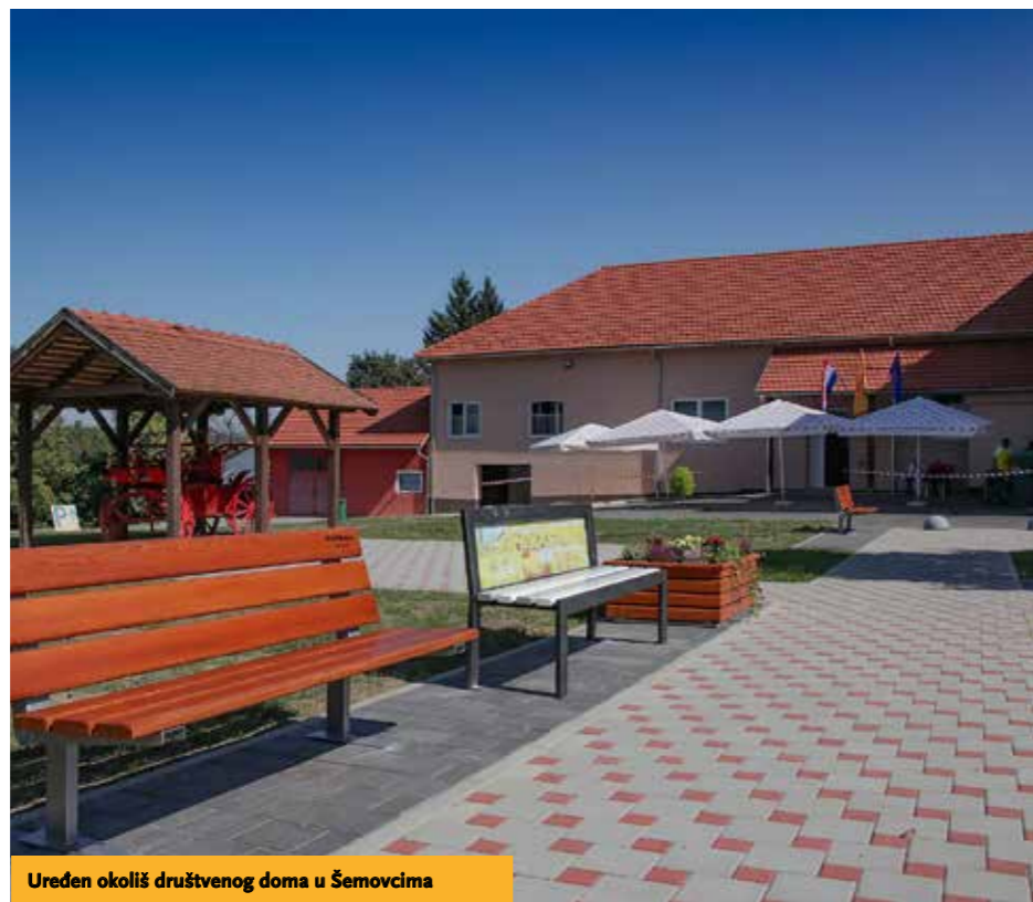
Uređen okoliš društvenog doma u Šemovcima