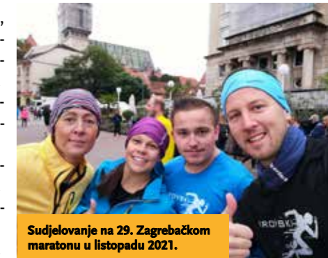
Sudjelovanje na 29. Zagrebačkom maratonu u listopadu 2021.

opreme je vizualno prepoznavanje kao Virovskih Ranera i povezivanje s Virjem.