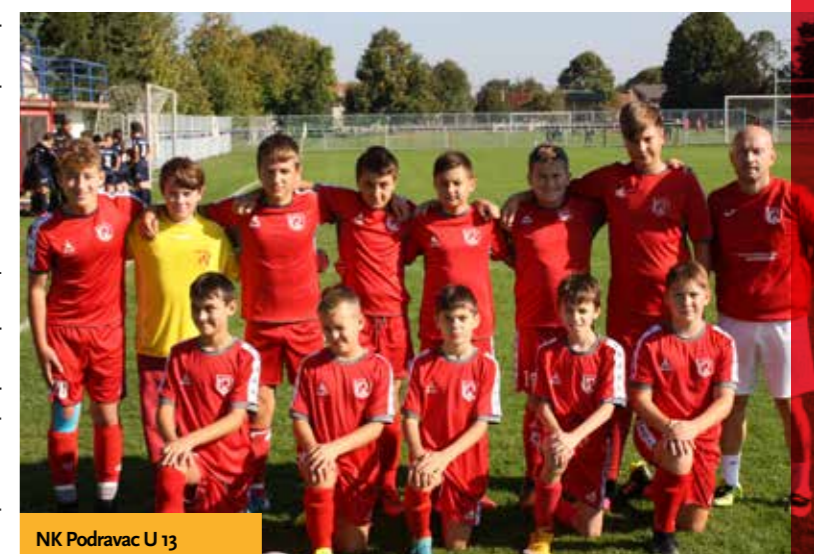
NK Podravac U 13

U zimskoj stanci ekipe Podravca, zbog novog vala pandemije koronavirusa, nisu imale aktivnosti u dvoranu pa su s treniranjem nastavile tek dolaskom lijepog vremena ponovnim izlaskom na vanjske terene. Valja napomenuti da je ekipa sastavljena od dječaka 2003. godišta, 2004. godišta, 2005. godišta izborila plasman na