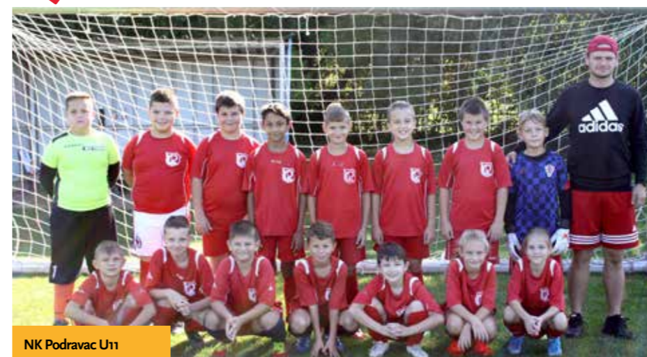
NK Podravac U11

Nakon pandemijom obilježene 2020. godine i prekida prošlogodišnje sezone svim uzrastima, sezona 2020./2021. odigrana je u cijelosti uz pridržavanje propisanih epidemioloških mjera. Nova sezona počela je u ljeto 2020. godine i završila u ljeto 2021. godine. Najveći problem prošle sezone bile su zatvorene tribine te su sve lige odigrane bez gledatelja.