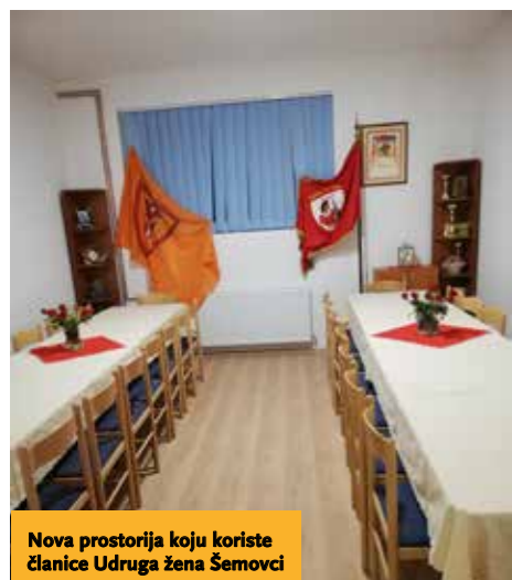
Nova prostorija koju koriste članice Udruga žena Šemovci