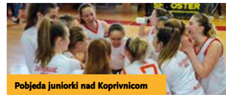
Pobjeda juniorki nad Koprivnicom

Kadekinje su prošle godine odigrale 9 od predviđenih 12 utakmica i suvereno držale prvo mjesto, a zatim su nakon odustajanja pojedinih ekipa proglašene prvakinja regije Sjever i time se plasirale u poluzavršnicu koja im je donijela gostovanje kod ŽKK-a FSV iz Rijeke. Zbog ograničenog treniranja 21. lipnja 2021. ekipa nije imala prilike kvalitetnije odgovoriti na pritisak domaćina i porazom je završila ovo natjecanje. Juniorki su svoju ligu od 10 kola od kraja veljače do kraja travnja 2021. uspjele regularno završiti. U kvalitetno postavljenoj ekipi nedostajalo je samo malo sportske sreće da i one ponese naslov regionalnih prvakinja i uđu u poluzavršnicu prvenstva Hrvatske. Neugodnim gostujućim porazom od Koprivnice (11 razlike) i osobito nes(p)retnim porazom (1 razlike) u Čakovcu