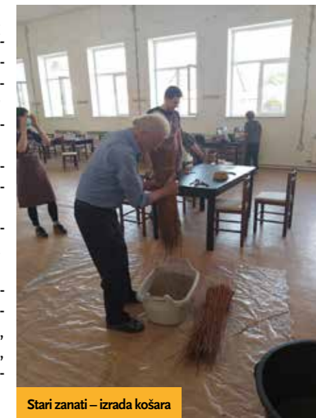
Stari zanati – izrada košara