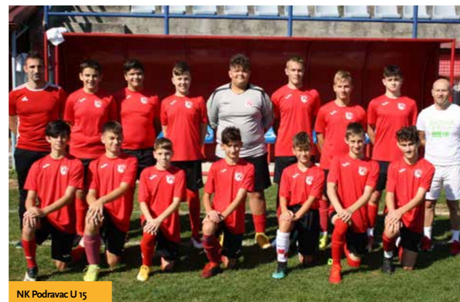
NK Podravac U 15

državnoj završnici na Coca Cola KUP-u u Splitu.