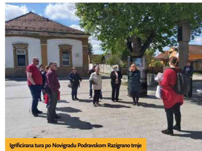
Igrificirana tura po Novigradu Podravskom Razigrano trnje