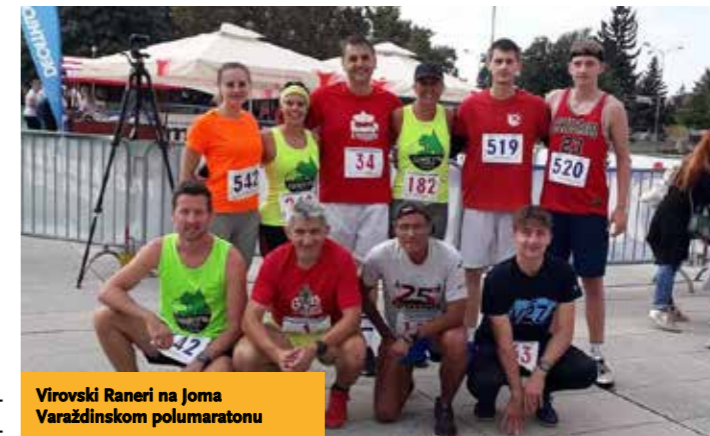
Virovski Raneri na Joma Varaždinskom polumaratonu