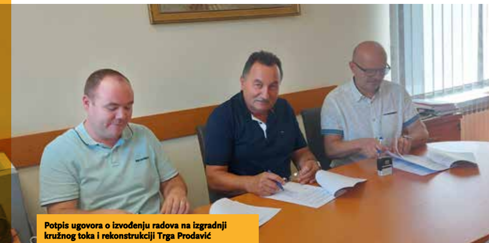
Potpis ugovora o izvođenju radova na izgradnji kružnog toka i rekonstrukciji Trga Prođavić