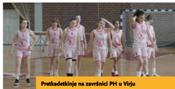
Pretkadekinje na završnici PH u Virju

Virovska ženska košarka u posljednjih je godinu dana bila u prijelaznom razdoblju uprave i trenera uslijed kojih je uspjele nastaviti s kontinuitetom dobrih igara i radom s najmlađima. U sezoni 2020./2021. ekipe su se natjecale u ligama pretkadekinja (U15), kadekinja (U17), juniorki (U19) i seniorki; a u novoj sezoni započelo se raditi na prvim (dvo)koraznim igračica rođenih između 2009. i 2013. godine što je preduvjet za opstojnost bilo kojeg sportskog kluba.