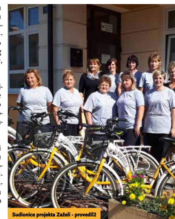
Sudionice projekta Zaželi - provedi2