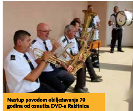
Nastup povodom obilježavanja 70 godina od osnutka DVD-a Rakitnica