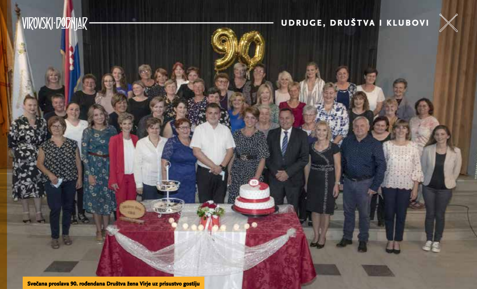
Svečana proslava 90. rođendana Društva žena Virje uz prisustvo gostiju