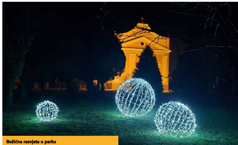
Božićna rasvjeta u parku