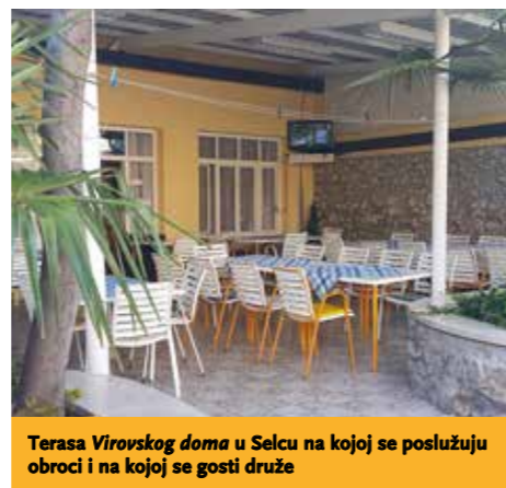
Terasa Virovskog doma u Selcu na kojoj se poslužuju obroci i na kojoj se gosti druže