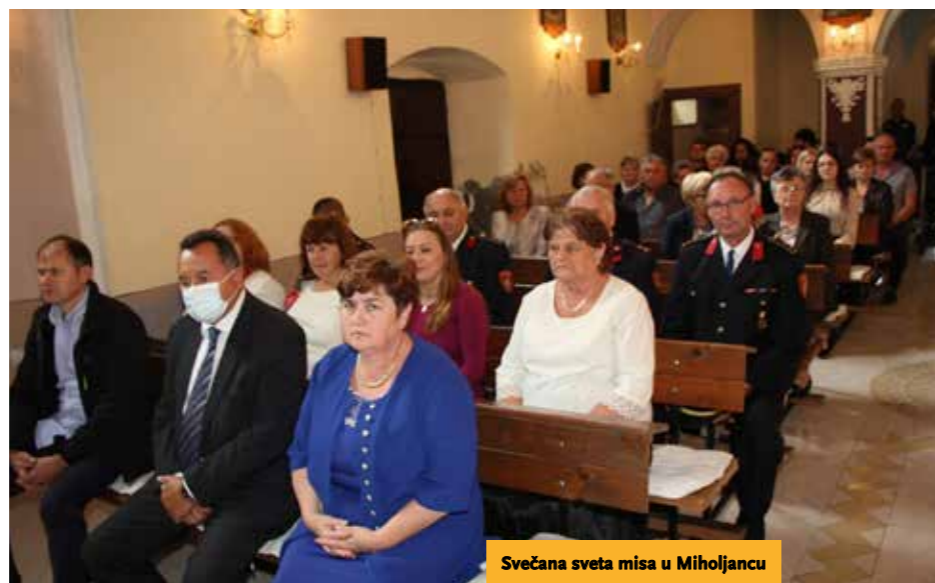
Svečana sveta misa u Miholjancu