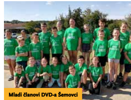
Mladi članovi DVD-a Šemovci