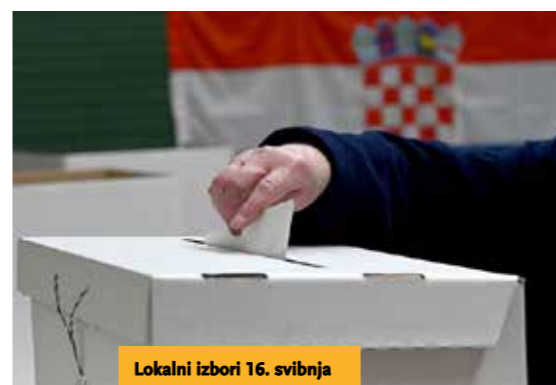
Lokalni izbori 16. svibnja