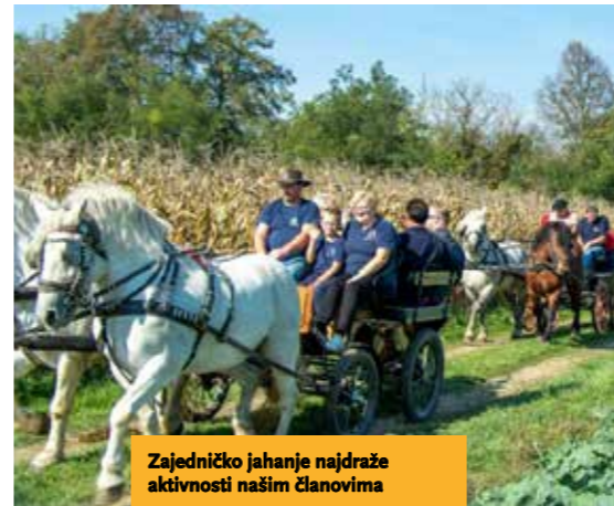
Zajedničko jahanje najdraže aktivnosti našim članovima