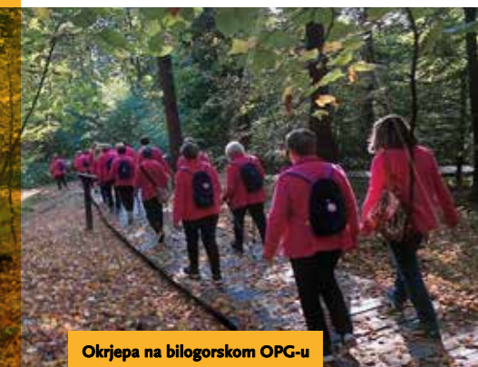
Okrjepa na bilogorskom OPG-u

Dana 10. lipnja 2021. uspjele smo održati 5. Izbornu skupštinu Udruge na kojoj je izabrano novo rukovodstvo. Za predsjednicu