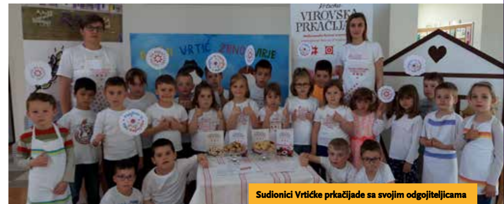
Sudionici Vrtićke prkačijade sa svojim odgojiteljicama

U filmu se pojavljuju turistički vodič i gost koji obilaze destinacije i upoznaju ljude i običaje. Uključena su bila sva djeca iz skupine i svatko je imao svoju ulogu i zadatak predstaviti dio kulturne, društvene i gastro-turističke ponude. Tako su djeca iz Virja predstavila crkvu sv. Martina i legendu o sv. Martinu, Narodnu knjižnicu i čitaonicu, Zavičajni muzej, Osnovnu školu prof. F. V. Šignjara i sportski park, Prkačijadu, Biciklijadu. Djeca iz Miholjanca predstavila su izvor pitke vode Fratrov zdenac – Fratrovec , djeca iz Hampovice kapelicu sv. Martina na Straži, a djeca iz Šemovaca izvor vode Zviršće .