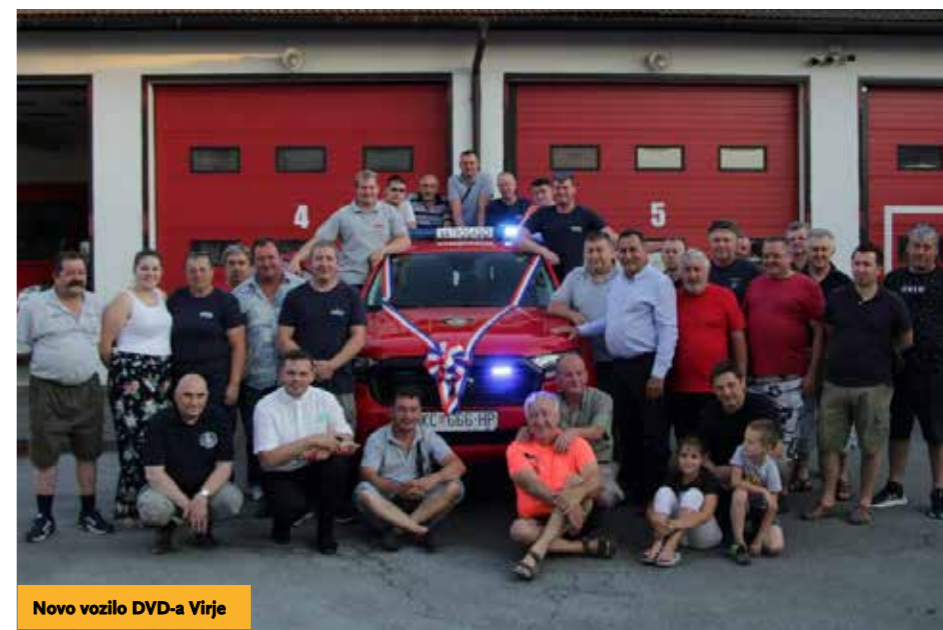
Novo vozilo DVD-a Virje