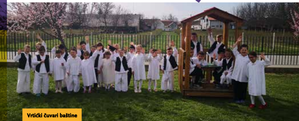
Vrtićki čuvari baštine

Dječji vrtić Zrno Virje u pedagoškoj godini 2020./2021. provodio je 10-satni primarni program predškolskog odgoja i obrazovanja za djecu od navršene godine dana života do polaska u školu, a tijekom godine njime je bilo obuhvaćeno 95-ero djece i to po prvi put u pet odgojnih skupina – mlađoj i starijoj jasličkoj te tri mješovite vrtićke odgojne skupine.