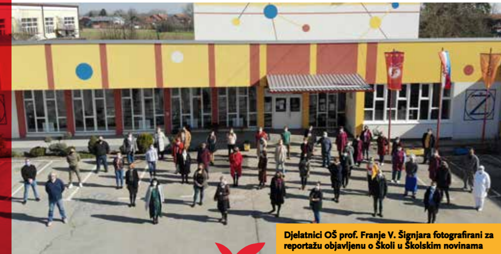
Djelatnici OŠ prof. Franje V. Šignjara fotografirani za reportažu objavljenu o Školi u školskim novinama