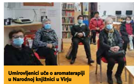
Umirovljenici uče o aromaterapiji u Narodnoj knjižnici u Virju