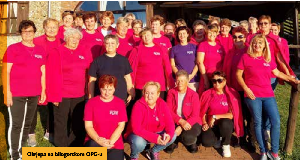
Okrjepa na bilogorskom OPG-u

ROZE – udruga za promicanje zdravlja seoskih žena