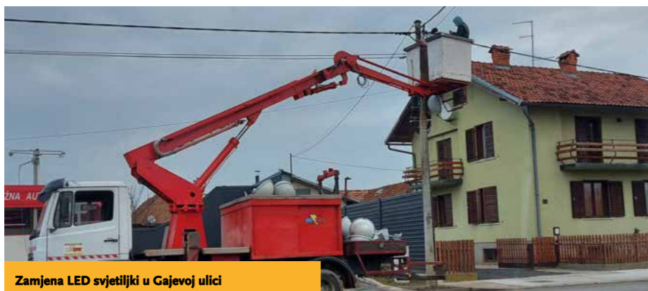
Zamjena LED svjetiljki u Gajevoj ulici

Tijekom prosinca 2020. godine u Gajevoj ulici i u Ulici Trnovac u Virju zamijenjene su sve postojeće svjetiljke s LED žaruljama da omoguće bolju vidljivost i osvijetljenost sukladno standardima. Zamjenu žarulja obavila je tvrtka Nitre d.o.o. Koprivnica koja održava javnu rasvjetu na području općine Virje, a trošak zamjene financirala je Općina vlastitim sredstvima s preko 150.000,00 kuna. U narednom razdoblju planira se postupno zamjenjivanje svih žarulja na području općine Virje LED javnom rasvjetom. ●