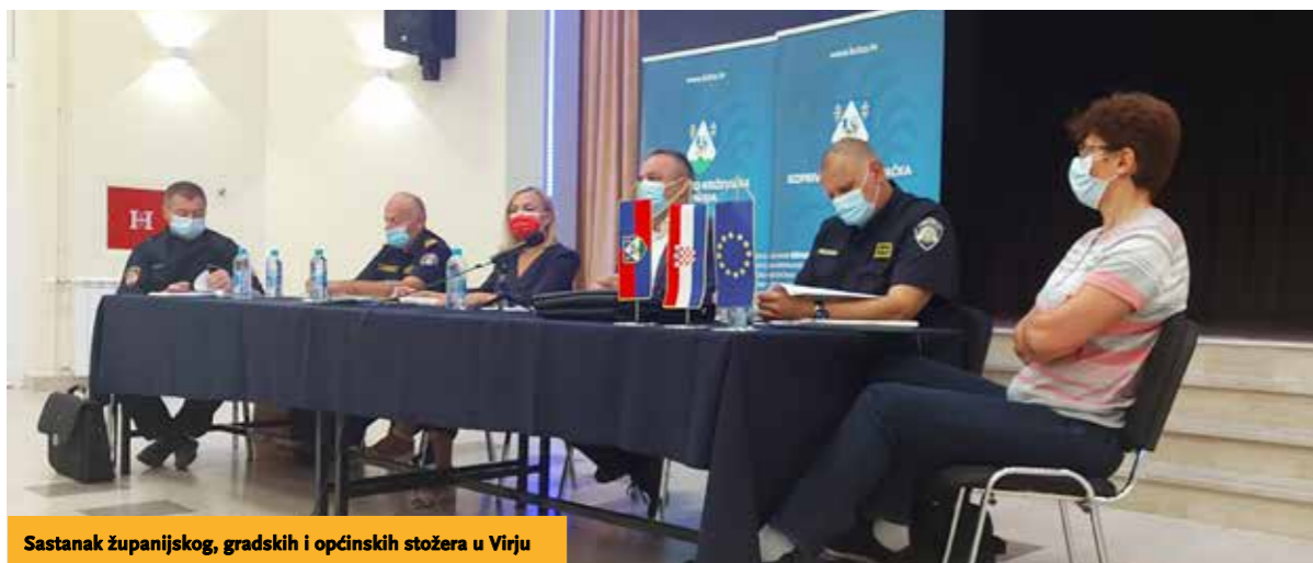
Sastanak županijskog, gradskih i općinskih stožera u Virju