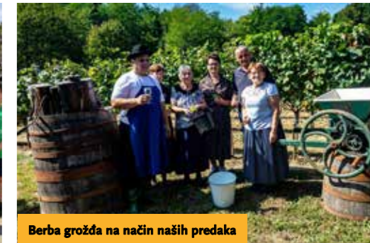
Berba grožđa na način naših predaka