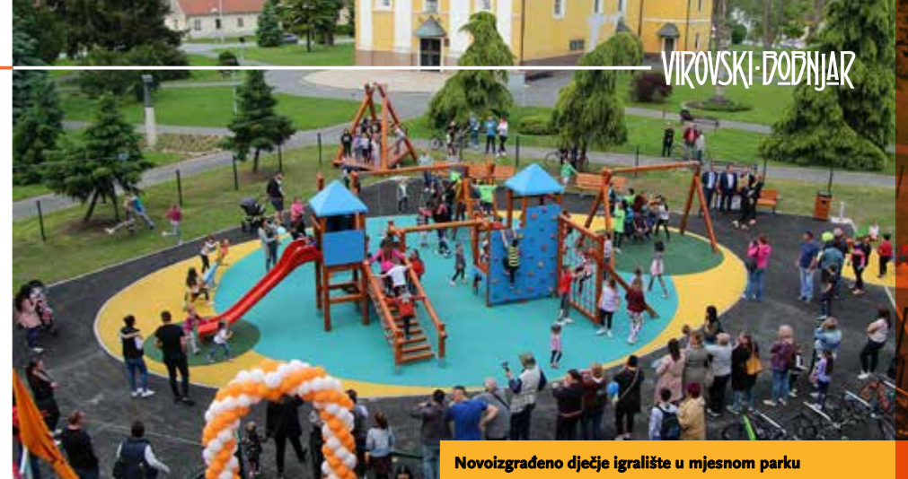
Novoizgrađeno dječje igralište u mjesnom parku

Projekt cjelovitog rješavanja vodnokomunalne infrastrukture na području Aglomeracije Đurđevac, Novigrad Podravski, Virje i Podravske Sesvete u okviru kojeg je projektirana i kanalizacija naselja Šemovci i Hampovica je u tijeku. Nositelj projekta su Komunalije d.o.o. Đurđevac. Vrijednost projekta je 282 milijuna kuna od čega je 196,5 milijuna osigurano iz fonda Europske unije, 79,5 milijuna iz državnog