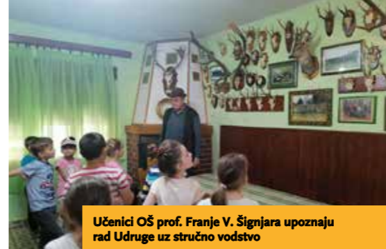
Učenici OŠ prof. Franje V. Šignjara upoznaju rad Udruge uz stručno vodstvo