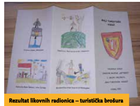
Rezultat likovnih radionica – turistička brošura

U svakoj šetnji selom pokušali su napraviti rutu kojom bi proveli turiste koji bi došli k nama u goste. Kod svake kulturne, društvene i zabavne građevine naučili su kako se zovu, tko u njima radi i čega u njima ima. Djeca su na kraju projekta posve samostalno znala prezentirati Narodnu knjižnicu i čitaonicu, Zavičajni muzej, crkvu sv. Martina, izvore vode u Šemovcima i Miholjancu te kapelicu sv. Martina na straži u Hampovici. Sljedeći korak u našem projektu bilo je upoznati djecu i s gastro-turističkom ponudom pa smo se u svibnju 2021. puno bavili Virovskom prkačijadom – međunarodnim festivalom sitnih kolača koji se već nekoliko godina održava kod nas.