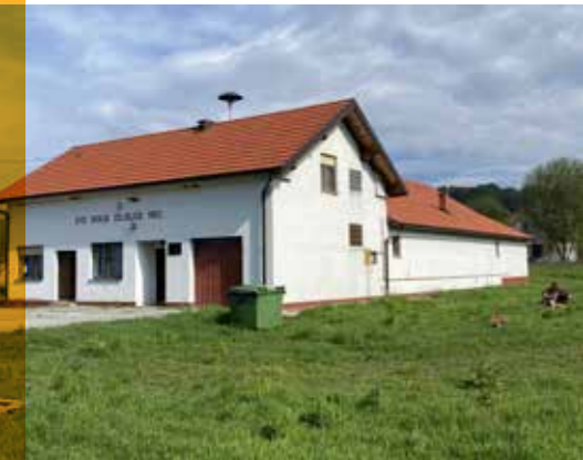
Mjesni odbor Donje Zdjelice