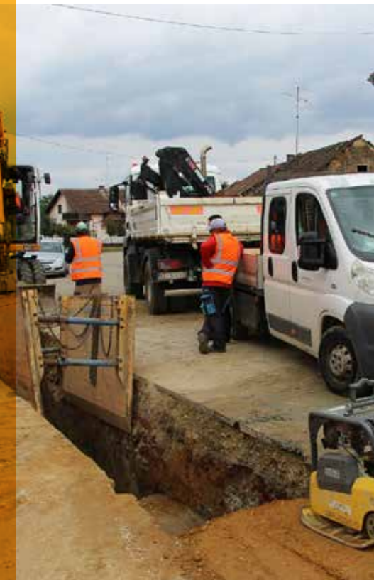
Radovi na zamjeni komunalne infrastrukture na Trgu Prođavić