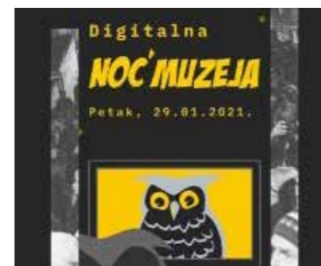
Najava digitalne Noći muzeja 2021. godine