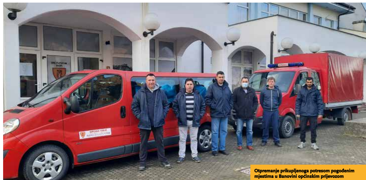
Otpremanje prikupljenoga potresom pogođenim mjestima u Banovini općinskim prijevozom