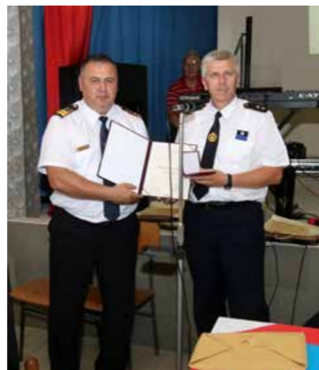
Glavni vatrogasni zapovjednik RH Slavko Tucaković i predsjednik DVD-a Rakitnica Zlatko Vukres

Na sjednici Upravnog odbora Društva 6. srpnja 2020. g. donijeli smo odluku o prodaji vatrogasnog vozila Magirus-Deutz. Vozilo je bilo staro 40 godina i više nije bilo sigurno za obavljanje vatrogasne djelatnosti. Krenuli smo u prikupljanje financijskih sredstava i traženje manjeg vozila koje bi zadovoljilo naše potrebe. Na aukciji u Francuskoj 23. travnja 2021. g. uspjeli smo kupiti vatrogasno vozilo Renault Mascot. Vozilo je očuvano sa svega 19 000 km, ima dvostruku kabinu i nadogradnju izradenu prema standardima zapadnoeuropskog tržišta. Početkom svibnja 2021. g. vozilo je stiglo u RH. Vjerujemo da će na duže vrijeme