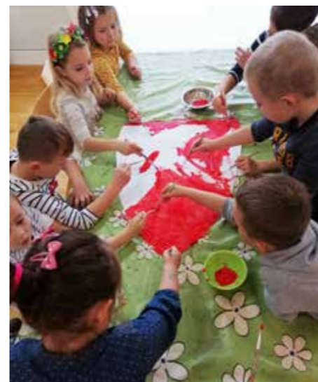
Dvije od mnogobrojnih vrtićkih radionica

Nakon upoznavanja svih destinacija naše općine i likovnog izražavanja, nastali su jako dobri radovi koje smo uobličili u turističku brošuru te je tiskali u vlastitoj nakladi i podijelili roditeljima na završnoj svečanosti. Kao kruna rada na ovom projektu je kratki film Mali turistički vodič snimljen prema vlastitom scenariju, a koji je premijerno prikazan na završnoj svečanosti.