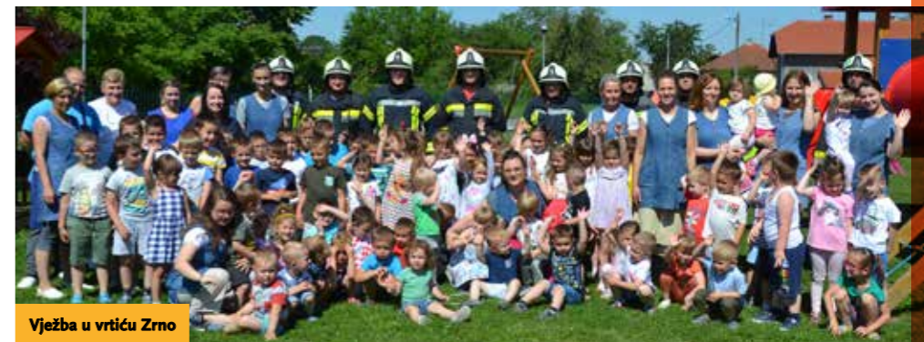
Vježba u vrtiću Zrno