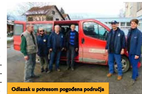
Odlazak u potresom pogođena područja

Aktivnosti su Udruge dragovoljaca i veterana Domovinskoga rata Ogranak općine Virje tijekom prošle 2020. i ove 2021. bile svedene na minimum zbog pandemije koronavirusa, no nije da ih uopće nije bilo. Krajem 2020. godine na Dan sjećanja na žrtve Domovinskog rata i Dan sjećanja na žrtvu Vukovara i Škabrnje 18. studenoga u suradnji s Općinom Virje duljinom cijelog Virja (Novigradska – Trg bana J. Jelačića (centar) – Mitrovica) upalili smo tisuću svijeća u spomen na žrtve Vukovara. I u ostalim mjestima naše općine naši su kolege iz Udruge upalili svijeće na prigodnim mjestima.