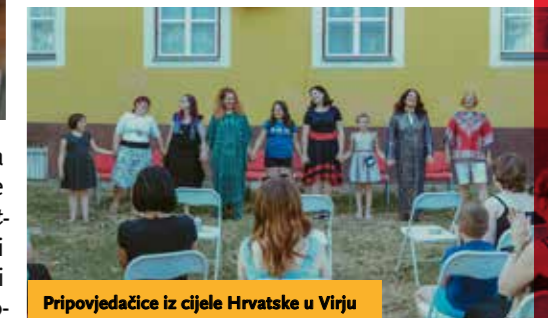
Pripovjedačice iz cijele Hrvatske u Virju

Umjetnost pripovijedanja – art of storytelling – zasebna je disciplina izvedbene umjetnosti koja se u svijetu već desetljećima razvija zasebno od dramskih i drugih vrsta izvedbi. Pripovjedači ponovno, kao u neka stara vremena, staju pred zajednicu i koristeći samo umijeće svojih riječi oživljavaju priče iz cijelog svijeta revitalizirajući tako gotovo izgublenu baštinu ljudskog roda.