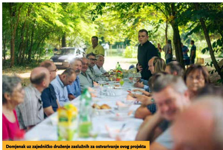
Domjenak uz zajedničko druženje zaslužnih za ostvarivanje ovog projekta