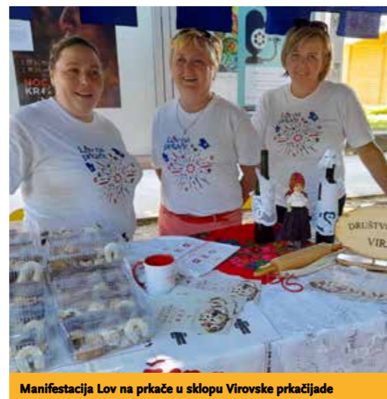
Manifestacija Lov na prkače u sklopu Virovske prkačijade