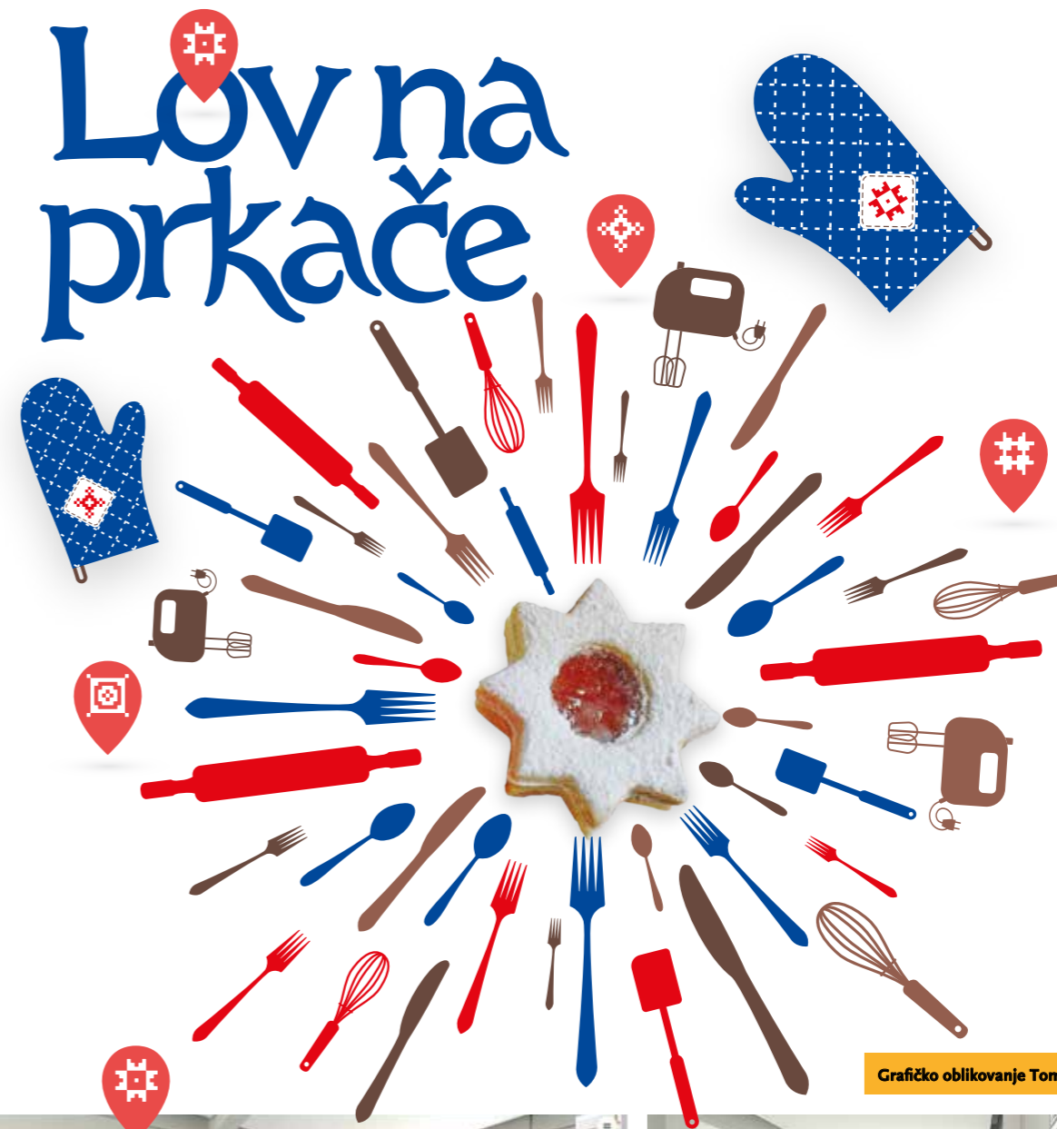
Grafičko oblikovanje Tomislav Turković, mag. diz.