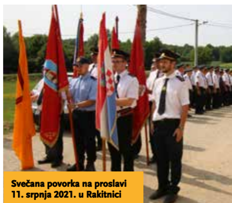
Svečana povorka na proslavi 11. srpnja 2021. u Rakitnici