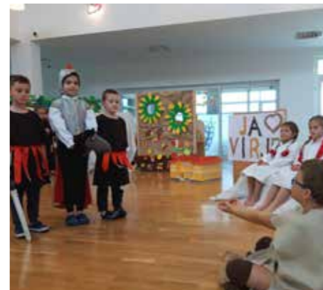
Scensko uprizorenje dobročinstva sv. Martina