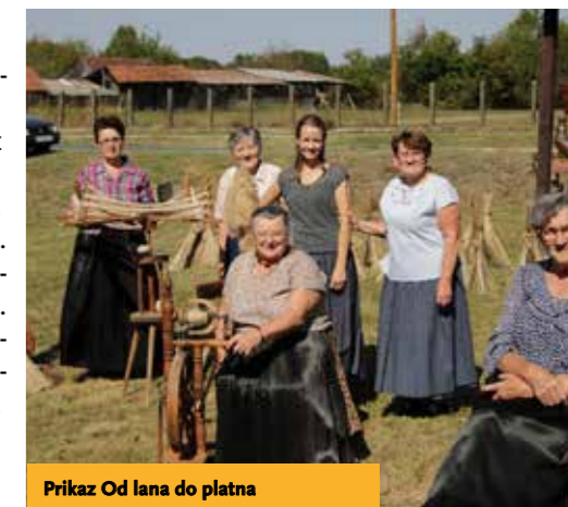
Prikaz Od lana do platna