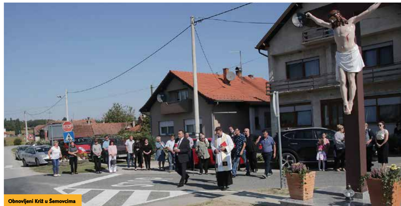
Obnovljeni križ u Šemovcima