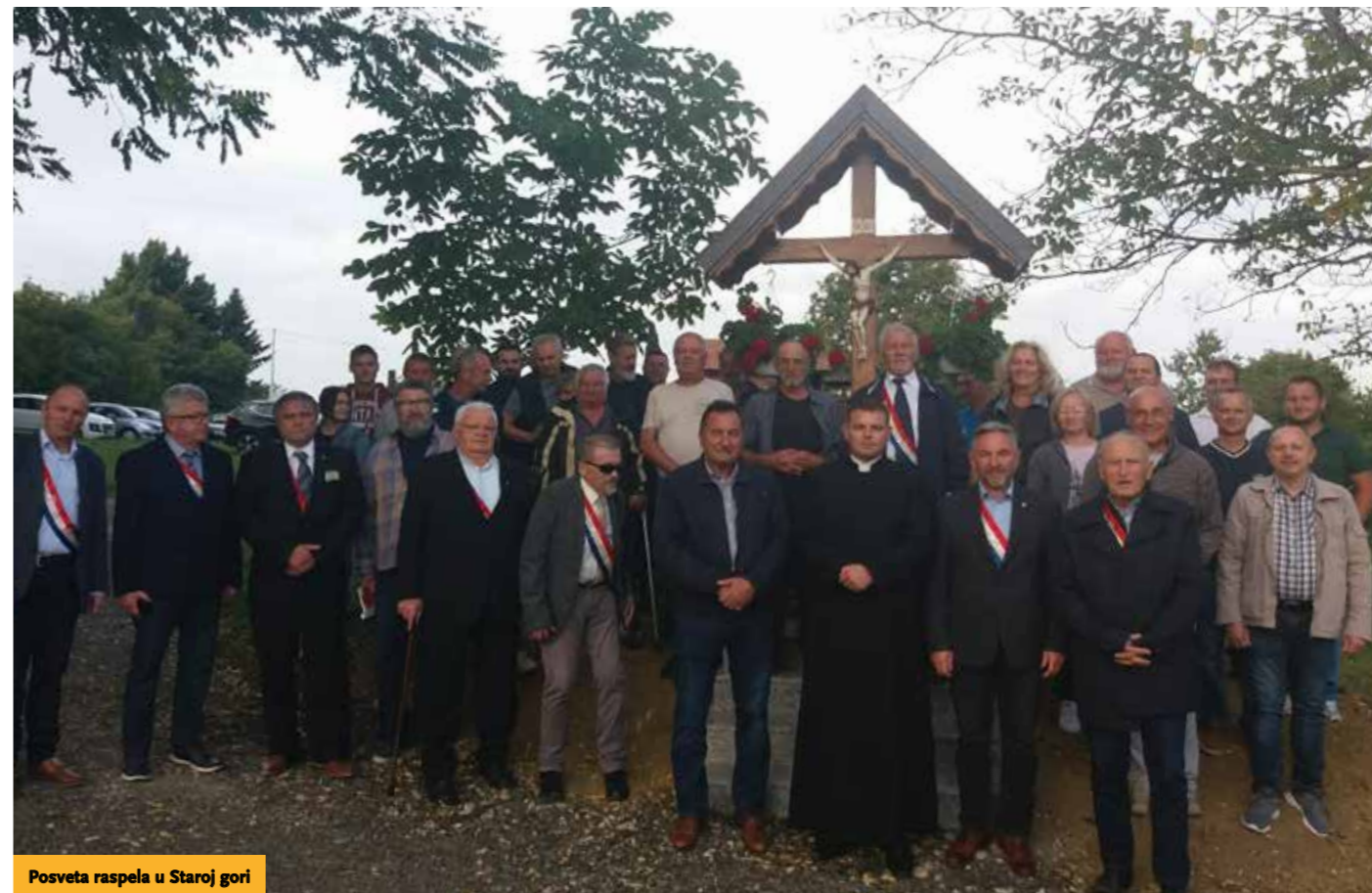
Posveta raspela u Staroj gori