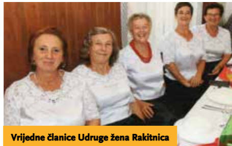
Vrijedne članice Udruga žena Rakitnica