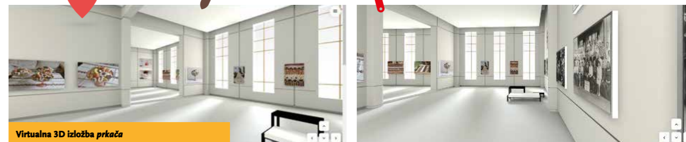
Virtualna 3D izložba prkača