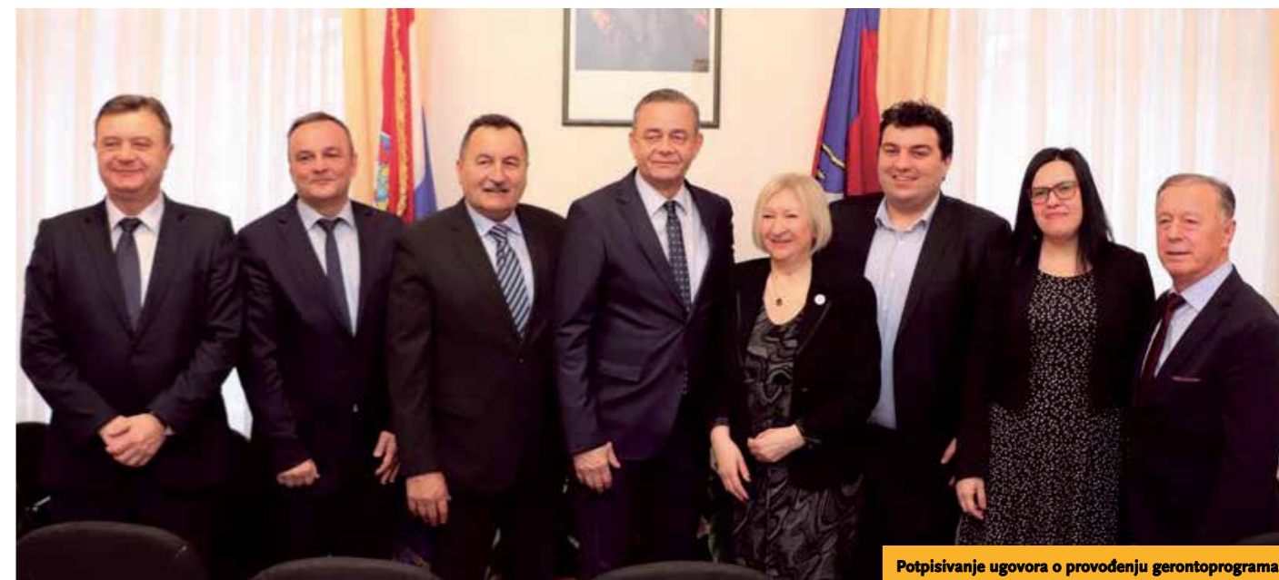
Potpisivanje ugovora o provođenju gerontoprograma