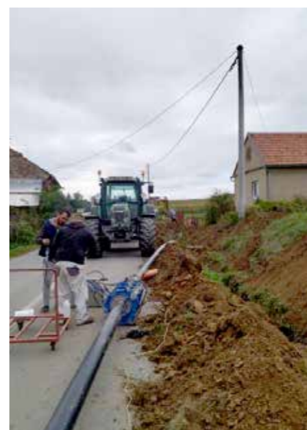
Radovi na polaganju vodovodnih cijevi u Donjim Zdjelicama

proračuna, dok će preostalih 5,7 milijuna izdvojiti lokalne samouprave. Udio u sufinanciranju Općine Virje u ukupnom projektu iznosi oko 1.000.000,00 kuna, a odnosi se na izgradnju kanalizijske mreže u Šemovcima i Hampovici. Postupak nabave i vođenja investicije vode Komunalije d.o.o.. Odabrani su izvođači po pojedinim dionicama te se očekuje početak radova. ●