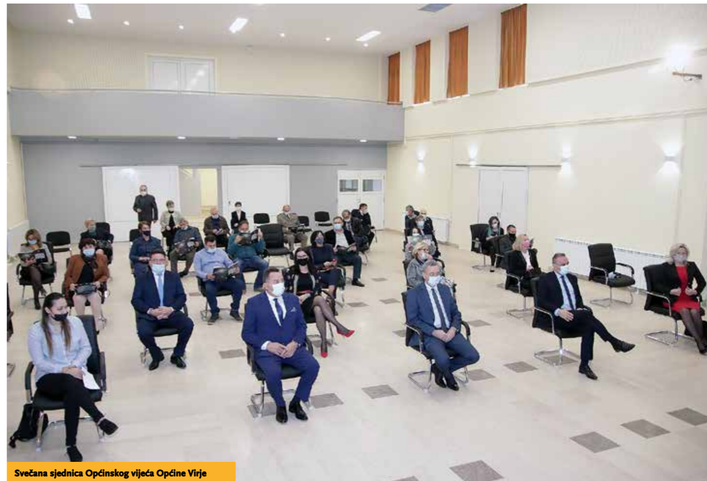
Svečana sjednica Općinskog vijeća Općine Virje

U ovim novonastalim okolnostima od velika značaja za mještane starije životne dobi bio je program Zaželi – provedi kojim smo organizirali brigu za starije i nemoćne te dostavu svih potrebnih prehrambenih namirnica. Osim djelatnica programa Zaže-