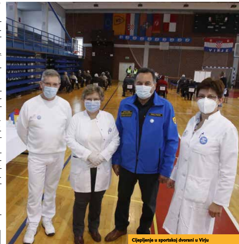
Cijepljenje u sportskoj dvorani u Virju

Sukladno uputi Hrvatskog Crvenog križa prikupljali su se trajni prehrambeni proizvodi, higijenske potrepštine i osobna zaštitna sredstva prema popisu. Donacije su se prikupljale u društvenom domu i u nekoliko trgovina na području općine, a na preuzimanju su dežurali volonteri.