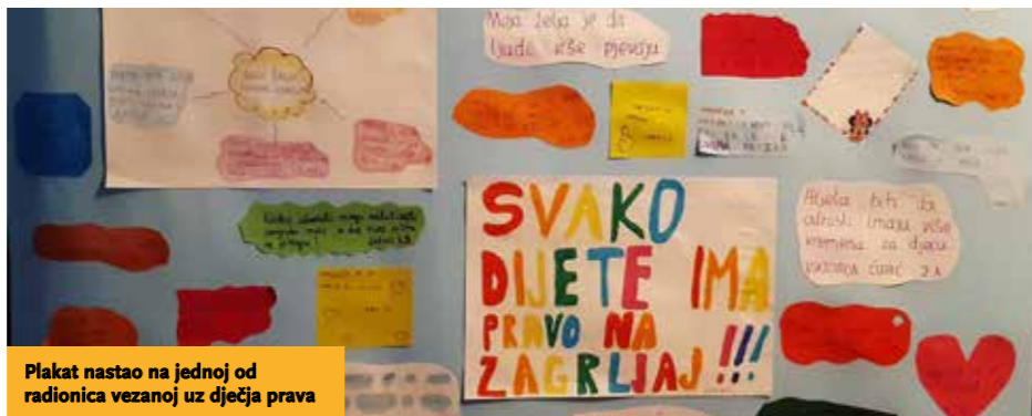
Plakat nastao na jednoj od radionica vezanoj uz dječja prava

plog doma preko društvenih mreža, bili smo jedni uz druge. I ove smo godine dokazali da smo vrlo složni i voljni pomoći kada je najteže. Kako nas je prošle godine osim virusa pogodio i potres, odlučili smo prikupiti potrebne namirnice, pribor i sve što treba djeci te se uključili u dvije humanitarne akcije za pomoć djeci u Petrinji. Prva humanitarna akcija bila je Djeca djeci u kojoj smo pakete nosili na kućni prag. Tada smo osobno vidjeli uvjete u kojima žive te barem na trenutak djeci izmamili osmijeh. Druga humanitarna akcija odvijala se preko udruge Učitelji za učitelje Petrinje u kojoj smo učiteljice i njihove učenike darivali paketima. U dogovoru s učiteljicama i upoznati s njihovim uvjetima rada prikupljali smo osnovni školski pribor, higijenske potrepštine, pokoji slatkiš i plišanu igračku za sreću i utjehu. Barem nakratko, zaboravili smo na sve probleme i vratili osmijeh na dječja ali i naša lica.