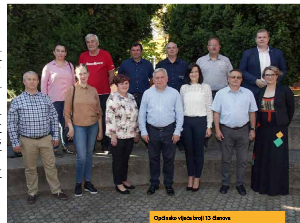
Općinsko vijeće broji 13 članova