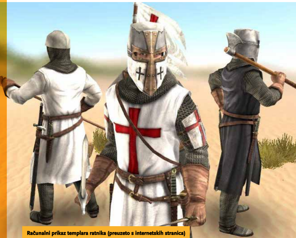
Računalni prikaz templara ratnika

U ugovoru o zamjeni zemlje između gospodara Prodavića i Ivanovaca iz 1358. godine piše da je Zdelja zamijenjena za imanje blizu Glogovnice .