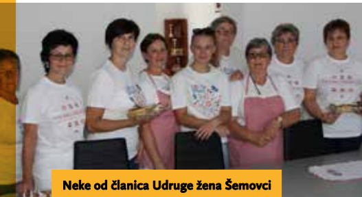
Neke od članica Udruga žena Šemovci