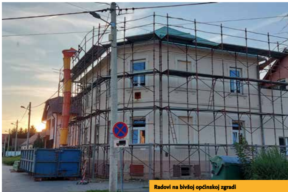
Radovi na bivšoj općinskoj zgradi

Ovaj projekt pod nazivom Stižem po tebe, nisi sam 3 sufinancira Ministarstvo rada, mirovinskog sustava, obitelji i socijalne politike. ●