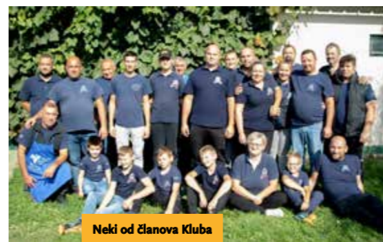
Neki od članova Kluba