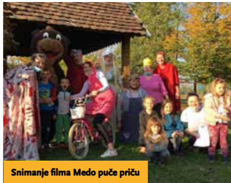
Snimanje filma Medo puče priču