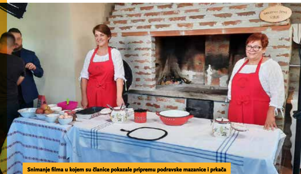
Snimanje filma u kojem su članice pokazale pripremu podravske mazanice i prkača

Sudjelovale smo u snimanju dugometražnog filma Zaboravljena jela Podravine o izradi podravske mazanice i prkača čime su koordinirale koprivničke tvrtke Creative Factory i Turističke zajednice Koprivničko-križevačke županije.