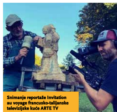
Snimanje reportaže Invitation au voyage francusko-talijanske televizijske kuće ARTE TV