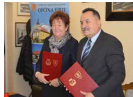
Potpis Sporazuma u Virju, 11. siječnja 2019.

Pripremajući sve materijale i pregledavajući fotografije o posjetima između Grada Nagybajoma i Općine Virje nisam sigurna što je bilo prije, prijateljstvo pa ideja o zajedničkom projektu ili je prvo postojala ideja o projektu s mađarskim gradom, a zatim to prijateljstvo koje se tako spontano i toplo razvilo.