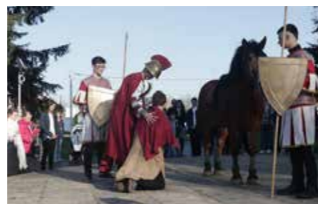
Prikaz dobročinstva sv. Martina

Istoga dana, održana je i svečana sjednica Općinskoga vijeća Općine Virje kojoj su nazočili brojni uvaženi gosti, predstavnici udruga i ustanova s područja općine i šire okolice.