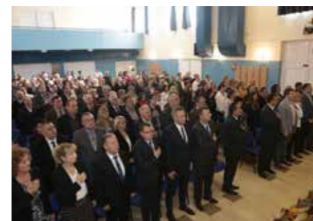
Svečana sjednica Općinskog vijeća Općine Virje

U cijelosti je realiziran projekt uređenja Ulice Ferde Rusana. Izgrađena je pješačka staza i uređen kolnik te kompletna sanacija staza u mjesnom parku u Virju te u jednom dijelu staza u Ulici Mitrovića. Realiziran je i projekt nabave fiksne opreme, igrala za naš dječji vrtić. Adaptiran je Društveni dom u Šemovcima. Radi se na projektnoj dokumentaciji za građevnu dozvolu za reciklažno dvorište koje se planira graditi sredstvima EU 2019. godine kao i na projektnoj dokumentaciji za sanaciju odlagališta otpada Hatačanova.