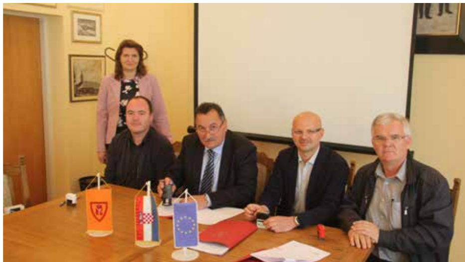
Početna konferencija i potpis ugovora na izgradnji reciklažnog dvorišta 23.5.2019.

Projekt je odobren za sufinanciranje iz EU fondova preko Ministarstva poljoprivrede za Mjeru 7.2. u okviru Programa ruralnoga razvoja za nerazvrstane ceste. U prvom dijelu 2018. godine proveden je postupak javne nabave, odabran izvođač radova Bistra d.o.o. Đurđevac s ugovorenim iznosom 4.992.945,00 kn od čega Europska unija iz Europskoga poljoprivrednoga fonda sufinancira s 3.518.098,38 kn (70,46 %), a udio Općine Virje je 1.474.846,62 kn (29,53 %). Radovi su trajali od sredine 2018., a u tijeku je ishođenje uporabne dozvole. ●