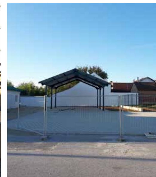
Novi izgled tržnice