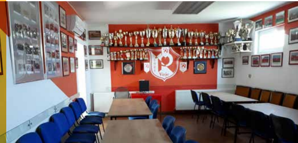
Prostorije SD Podravac