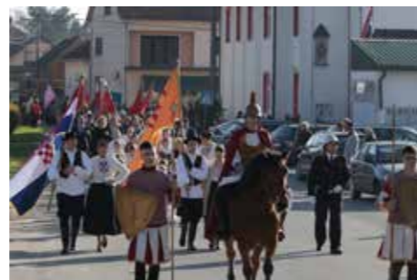
Svečana povorka kroz mjesto

Svečanu svetu misu na sam blagdan svetoga Martina 11. studenoga prenosila je Hrvatska radiotelevizija, a misi je prethodila svečana povorka i prikaz dobročinstva sv. Martina.