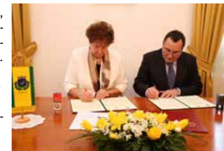
Radni sastanak na prijavi za INTERREG HU-HR

Zajednički projekt u turizmu i gastroturizmu prijavljen je 2. svibnja 2019. na natječaj INTERREG V-A Mađarska – Hrvatska 2014. - 2020. a prijavu je razradila PORA (Razvojna agencija Podravine i Prigorja) za Općinu Virje kao nositelja projekta i Grad Nagybajom kao partnera.