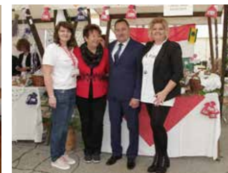
Grad Nagybajom na 4. Virovskoj prkačijadi, 11. svibnja 2019.