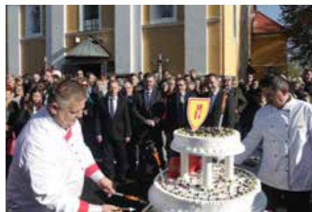
Torta za sve mještane povodom 25. rođendana Općine

Tradicionalno, u realizaciji programa sudjeluju sve ustanove i udruge s područja općine čime se može pohvaliti malo koja sredina. Tijekom 10-ak dana proslave mogli smo sudjelovati u brojnim događanjima: Dan otvorenih vrata Dječjega vrtića Zrno, 8. Martinjski kup Dušana Koščića u brzom spajanju usisnoga voda, Izložba Likovne sekcije HPD-a Ferdo Rusan , Kazališna večer Glumišne družine Virje, lovačka druženja uz izložbu trofeja, lov na zeca i 10. Kup u lovnom streljaštvu. Nadalje, prigodom proslave Dana Općine, novoosnovana Udruga dragovoljaca i veterana Domovinskoga rata općine Virje imala je svečanu posvetu barjaka. Svoju pokaznu povorku konjskih zaprega i jahača te druženje održali su Virovski konjanici. Puhački orkestar DVD-a Virje održao je samostalni koncert. Društvo Naša djeca organiziralo je etnoigre za djecu i odrasle. Kao i svake godine u OŠ prof. F. V. Šignjara održan je Kajkavski etnografski kviz i Predmartinjska večer kulture.