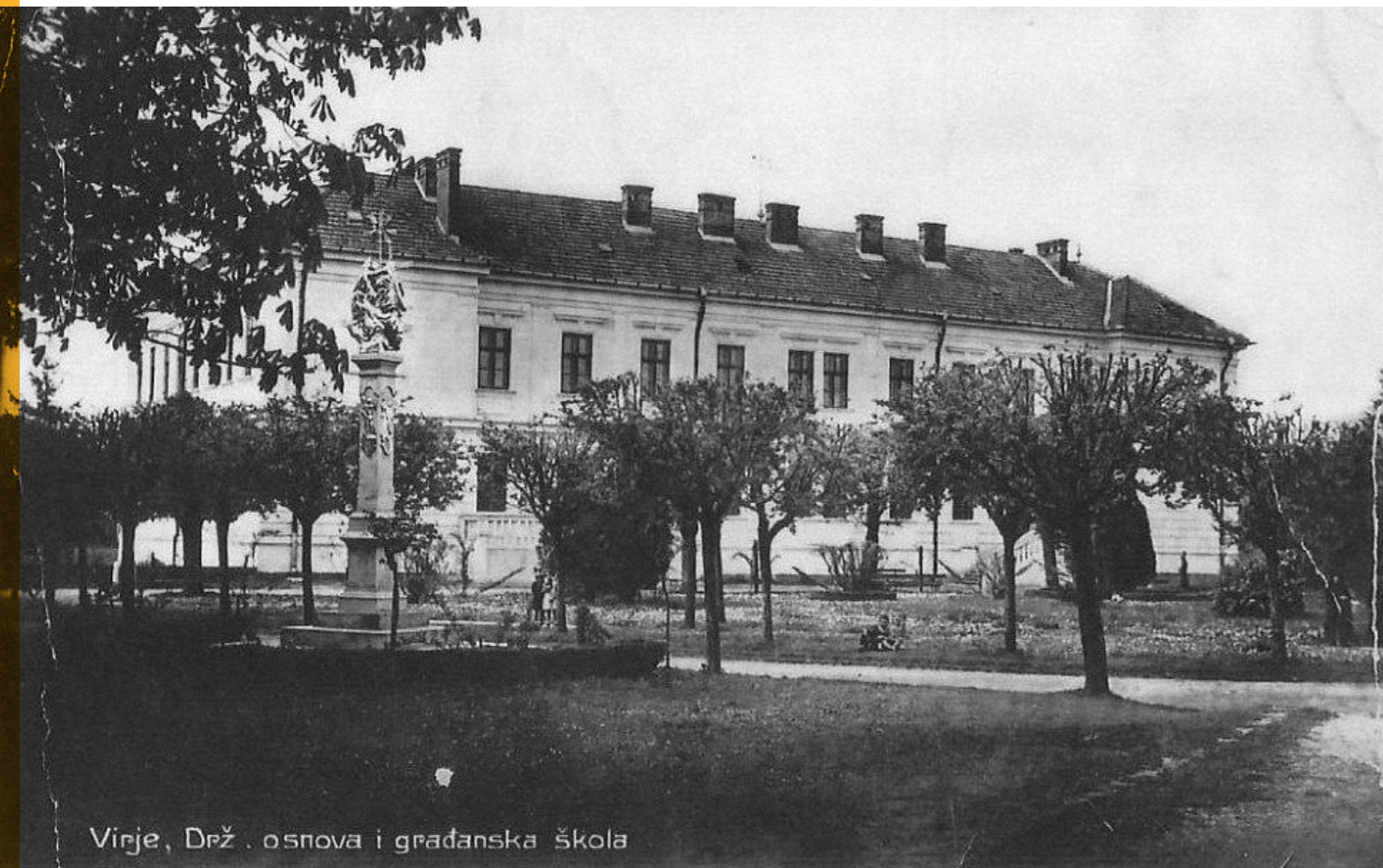
Virje, Drž. osnovna i građanska škola