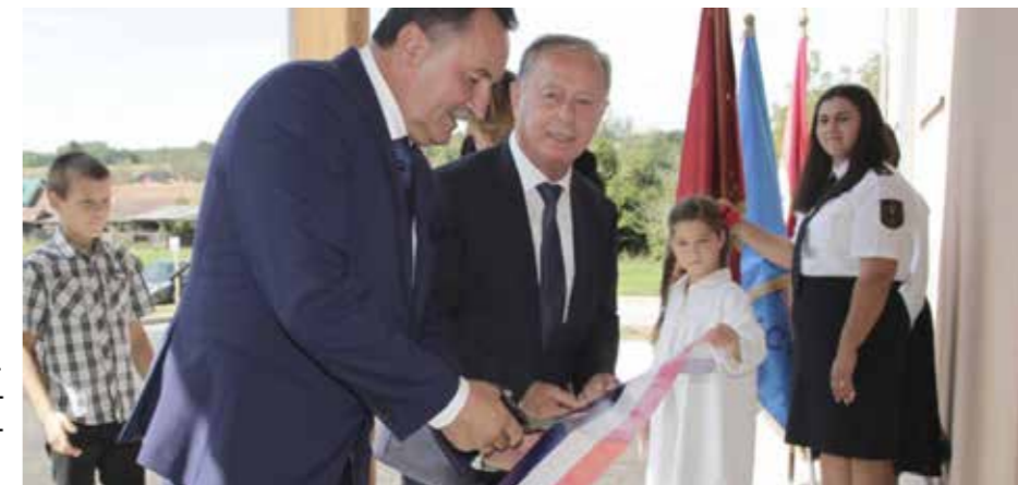
Svečano otvorenje novouređenog doma u Šemovcima